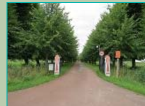
Hekpalen Ewsumborg, Middelstum

Bron: Kaart of landtafereel der provincie van Groningen en Ommelanden verdeelt in deszelfs byzondere quartieren, districten en voornaamste iurisdictionen : beneffens de Heerlykheid Westerwolde. - 1781 de Borgh Euwsum tot Middelstum