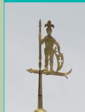
windvaan geschutstoren Ewsumborg, Middelstum