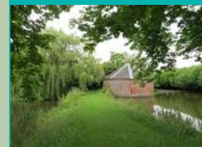
Geschutstoren Ewsumborg, Middelstum