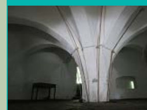
binnen in de donjon, Middelstum