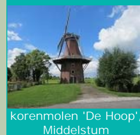
korenmolen 'De Hoop', Middelstum