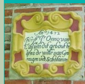
'1e steen' donjon, Middelstum