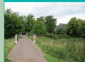
2e serie hekpalen Ewsumborg, Middelstum