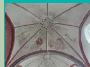
totaaloverzicht 'Laatste oordeel', Janskerk, Huizinge