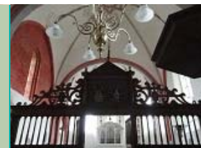
koorhek Janskerk, Huizinge