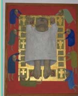
The Ascension | 1960/61 | Michael Reynolds

Emo was echter geen gewijde geestelijke, maar dat vonden de bewoners van