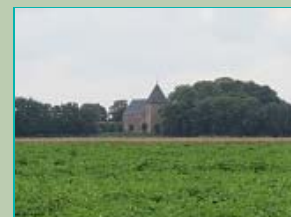
Janskerk (vanaf Huizingerweg), Huizinge