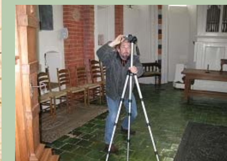
fotograferen in Janskerk, Huizinge

Bij binnenkomst valt meteen het koorhek op, dat Coenders in 1641 liet oprichten. Hierop het wapen van de familie Coenders en daarnaast het gevierendeeld wapen van Bernardus Coenders. In 1 en 4 de naar elkaar toe gewende bokken van het familiewapen en op 2 en 3 twee gouden kronen, die hij van koningin Christina van Zweden als wapenverrijking kreeg, vanwege zijn uitgeoefende ambassadeur-functie aan