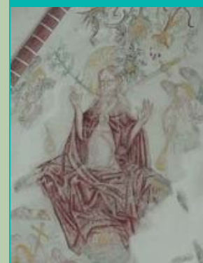
'Laatste oordeel', Janskerk, Huizinge