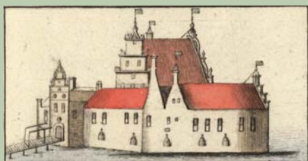
De borg Fraam (Huizinge) op de kaart Prov. Groningae et Omlandiae tabula, 1675-1680