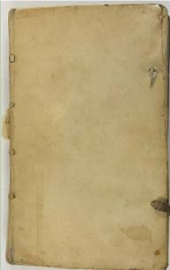
Cronica Floridi Horti - Kroniek van Wittewierum het oudst bekende versie van de kroniek.

Huizinge geen bezwaar. Hij was schoolmeester en had onder andere in Oxford en Parijs gestudeerd, waar hij vele boeken heeft overgeschreven. In Oxford staat hij bekend als de eerste overzeese student onder de naam Emo of Friesland . Dat overschrijven bleef hij ook in Huizinge doen. Het klooster waar hij 'abt' werd, stond in Wittewierum 1 ,