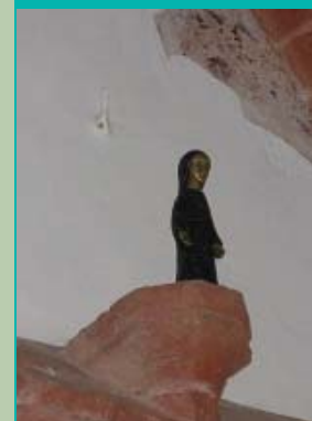
in het sacramentshuisje, Janskerk, Huizinge