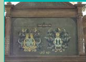
wapen Coenders Janskerk, Huizinge