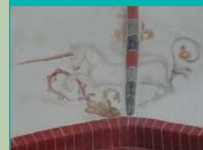
Eenhoorn, Janskerk, Huizinge