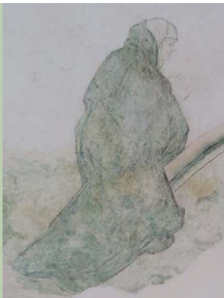
fresco detail, Sint-Hippolytuskerk, Middelstum

heeft meerdere restauraties gedaan in het noorden. Door dit langdurig verblijf zijn Otters eigen schilderijen ook duidelijk geïnspireerd door de kunstenaarsgroep De Ploeg.