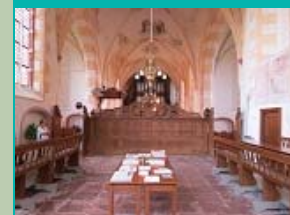
koor, Sint-Hippolytuskerk, Middelstum