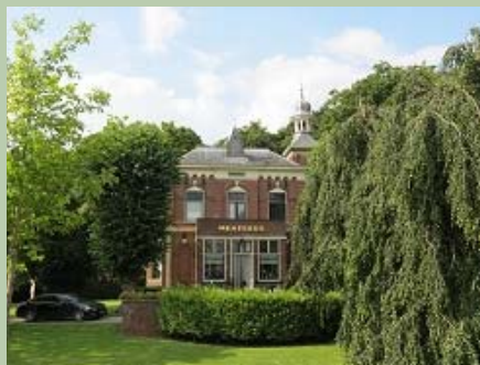
Mentheda in Middelstum, 2017