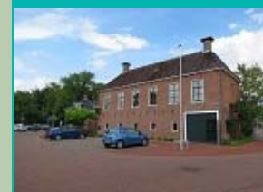
doorrit Herberg In De Valk, Middelstum