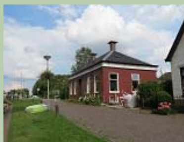
(voormalig plek) brouwerij De Pauw, Middelstum