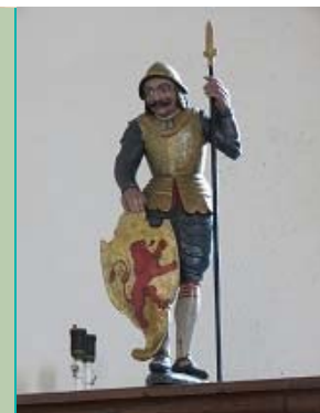
schild met Lewe-wapen bij "geharnaste beeld van Heiligen Hippolytus", Sint-Hippolytuskerk, Middelstum

bronnen: St. Hippolytuskerk Middelstum; Kerkkroniek / Elizabeth C.A. Vinhuizen. - p. 34; De apokryfe boeken des Nieuwen Verbonds / bijeenverz., uit de oorspronkelijke talen overgezet, en met inl. en aantek. voorz. [door J.P. de Keyser]. - 's Gravenhage : W.P. van Stockum, 1842-[1849]. - Eerste deel. - p. 227-228