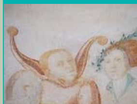
fresco detail, Sint-Hippolytuskerk, Middelstum