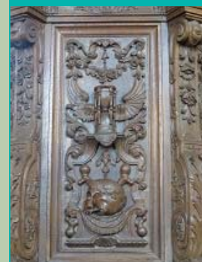
kuippaneel kansel met adelaar en vleermuisvleugel, Sint-Hippolytuskerk, Middelstum