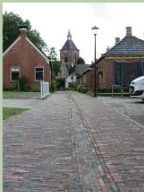
Kerkpad Sint Hippolytuskerk, Middelstum

Langs het water lopen we naar de Onno van Ewsomlaan waarna we via de Brouwerslaan weer teruggaan naar de Burchtstraat. Bij het Kerkpad krijgen we een mooi plaatje voorgeschoteld met de Hippolytuskerk in de hoofdrol. De Burchtstraat is een verwijzing naar de borg dat hier ooit stond. Een restant van de Asinga-borg, want zo heet de borg, komen we tegen in de vorm van een poort. Het is dan ook de hoogste tijd om even in de geschiedenis van Middelstum te duiken, want we hebben inmiddels kennism gemaakt met Mentheda en nu dus Asinga. De Onno van Ewsomlaan zal ons morgen naar zijn (voormalige) borg leiden. En zo zien we dat er drie borgen op een rij lagen, binnen een kilometer afstand.