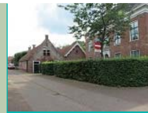
(voormalige) Bakkerij, Middelstum