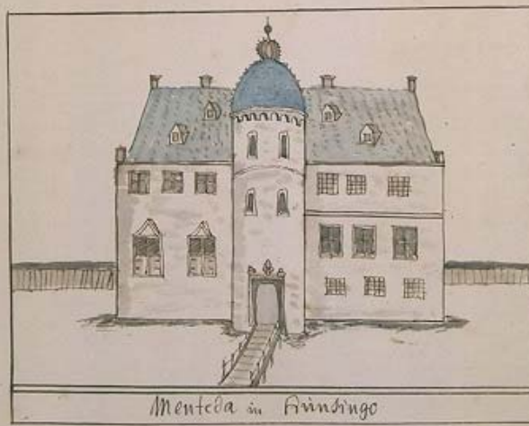
Mentheda in Hunsingo - Groningen en Ommelanden