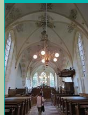
schip en koor, Sint-Hippolytuskerk, Middelstum