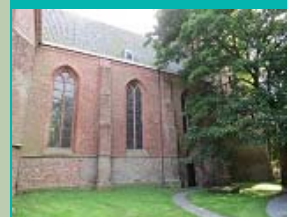
mix tufsteen / baksteen, Sint-Hippolytuskerk, Middelstum