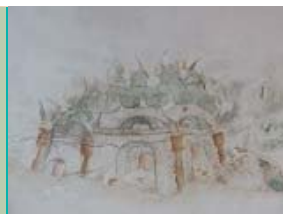
hemelgebouw, Sint-Hippolytuskerk, Middelstum