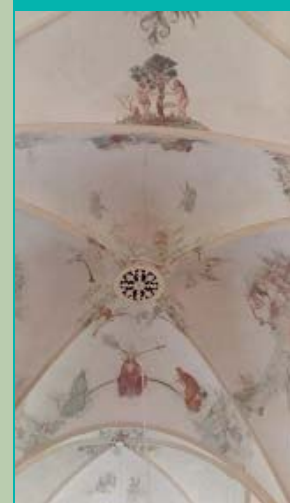
Adam en Eva / Christus op regenboog, Sint-Hippolytuskerk, Middelstum