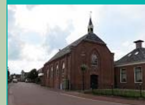
Doopsgezinde Kerk, Middelstum