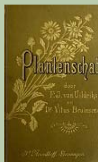
Plantenschat : Inleiding tot de kennis der flora van Nederland / F.J. van Uildriks, Vitis Bruinsma. - Groningen : P. Noordhoff, 1898 Driekleurig viooltje