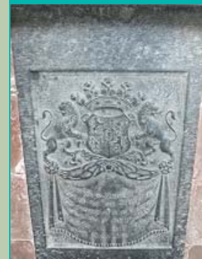
sluitsteen grafelder Ewsum, Sint-Hippolytuskerk, Middelstum