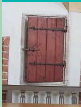
sacrementshuisje, Sint-Hippolytuskerk, Middelstum