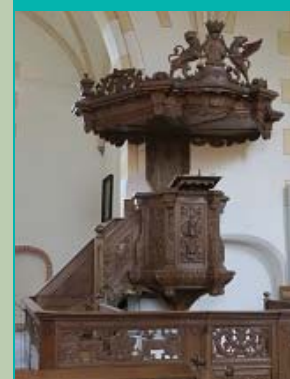
kansel | 1733 | Jan de Rijk, Sint-Hippolytuskerk, Middelstum