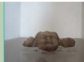
in het sacramentshuisje, Sint-Hippolytuskerk, Middelstum

In dit wapen zien we Hyppolytus staan, een legeroverste, die christen was in de tijd toen keizer Vespasianus in Rome dit nog bestreed. Hyppolytus werd door paarden