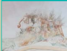
burcht van de hel, Sint-Hippolytuskerk, Middelstum