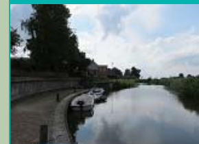
Boterdiep (bij de gedempte haven), Middelstum