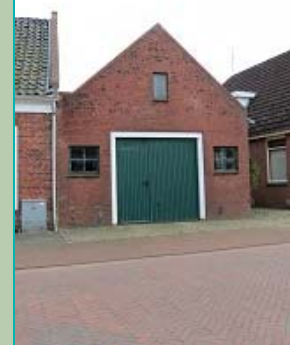
Oude Schoolsterweg, Middelstum