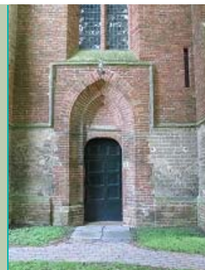
mix tufsteen / baksteen, Sint-Hippolytuskerk, Middelstum