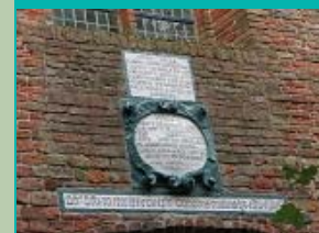
toren gedenksteden, Sint-Hippolytuskerk, Middelstum