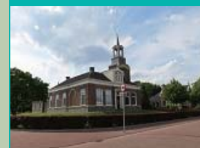
De Hoeksteenkerk, Middelstum