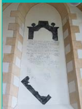
nis met kerkkroniek, Sint-Hippolytuskerk, Middelstum